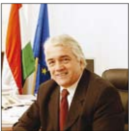
Csizmár Gábor Szociális és Munkaügyi Minisztérium, Államtitkár

XXI. században minden embernek nagyobb felelősséget kell vállalnia személyes, társadalmi, gazdasági és környezeti szerepéért.